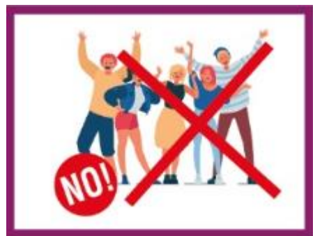
EVITER LES REGROUPEMENTS DE PERSONNES

Suivez les règles et protégez-vous et protégez les autres!