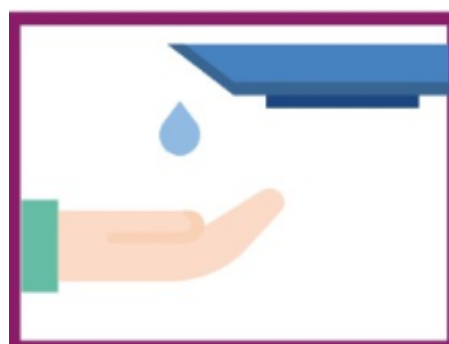
SE LAVER REGULIEREMENT LES MAINS