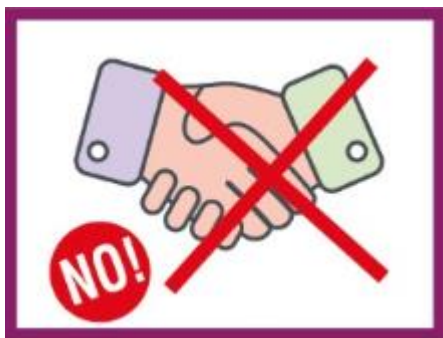
EVITER DE SERRER LA MAIN