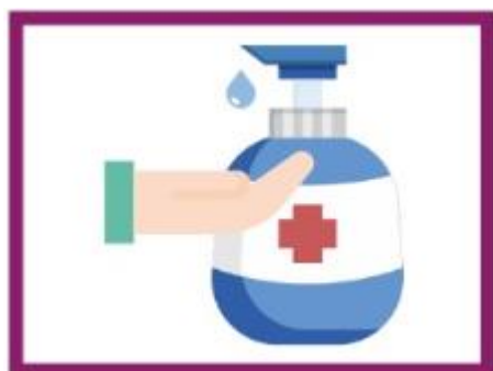
UTILISER LE GEL DESINFECTANT