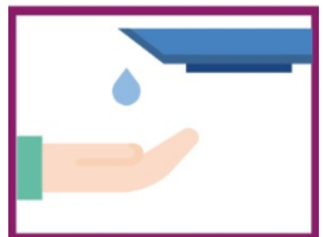
HÄNDE HÄUFIG WASCHEN