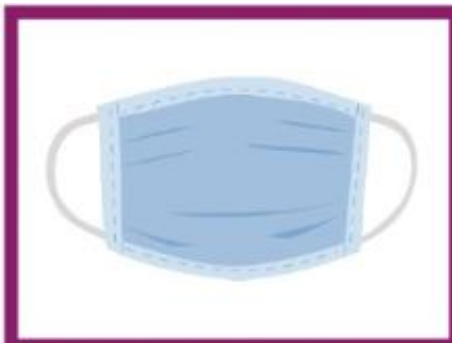
MASKENPFLICHT IN ÖFFENTLICHEN BEREICHEN