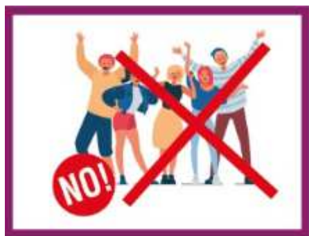
EVITER LES REGROUPEMENTS DE PERSONNES

Suivez les règles et protégez-vous et protégez les autres!