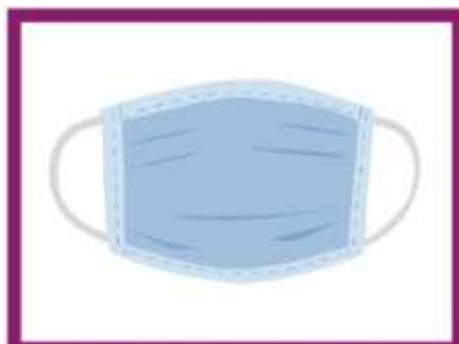
PORTER UN MASQUE DANS LES ESPACES EN COMMUN