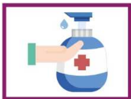
UTILISER LE GEL DESINFECTANT