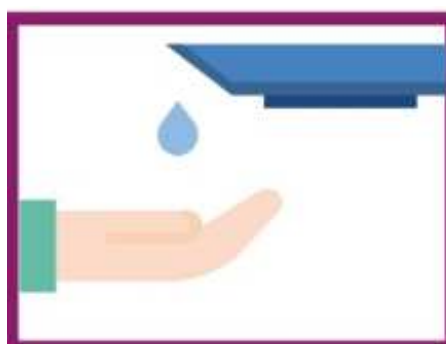
SE LAVER REGULIEREMENT LES MAINS