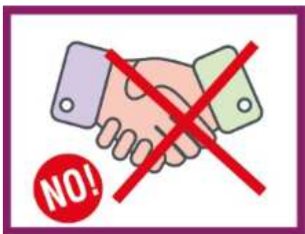
EVITER DE SERRER LA MAIN